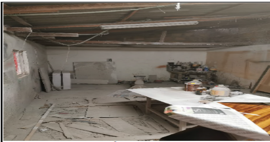
FOTO 5. ÁREA DE PINTURA