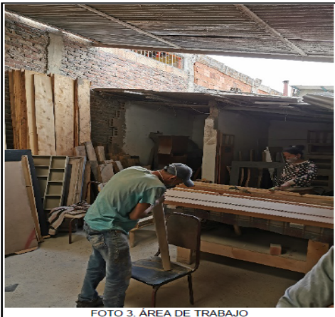
FOTO 3. ÁREA DE TRABAJO