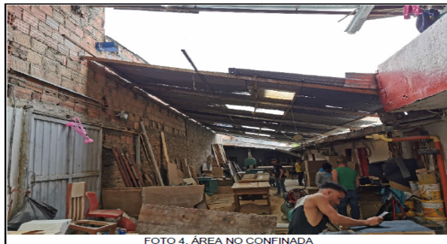
FOTO 4. ÁREA NO CONFINADA