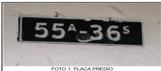
FOTO 1. PLACA PREDIO