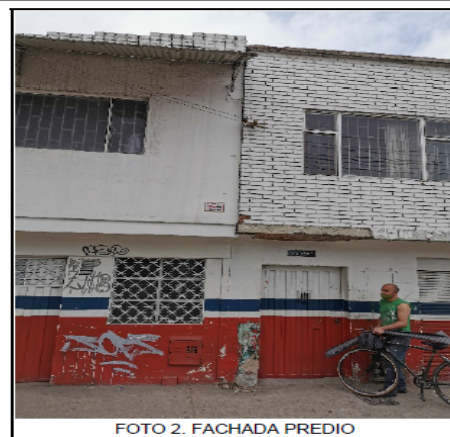
FOTO 2. FACHADA PREDIO